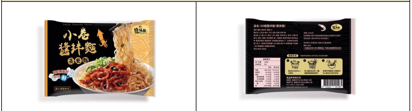
2.完整包裝產品(內包裝)正反面