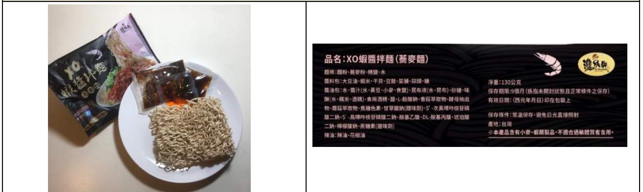
3.未包裝產品內容物