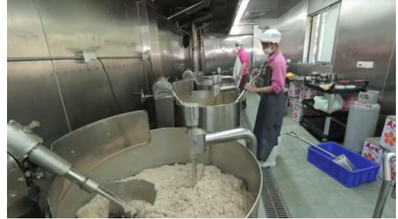
6.生產或加工場域照片